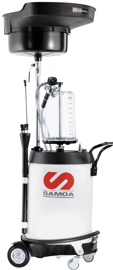
MOBILE WASTE OIL SUCTION DRAINER – DRAINER 100